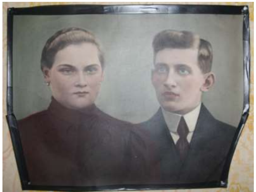
Apai nagyszülők. Kísérteties a hasonlóság nagyapám, apám és közöttem. Barátaink mondták is: Jön a három iker.