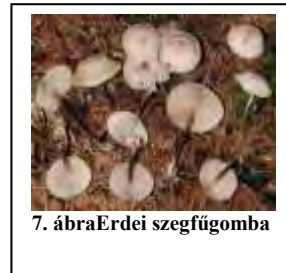
7. ábraErdei szegfűgomba