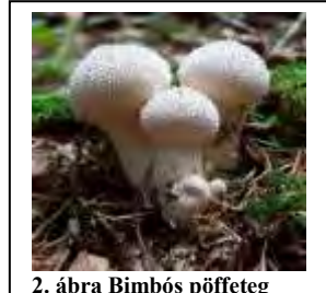
2. ábra Bimbós pöffeteg