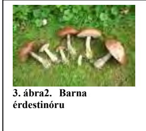
3. ábra2. Barna érdestinóru