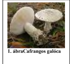
1. ábraCafrangos galóca