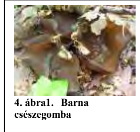
4. ábra1. Barna csészegomba

Szóval igen amatőr gyűjtemény, bocs. kedves Iváncsik Imre!