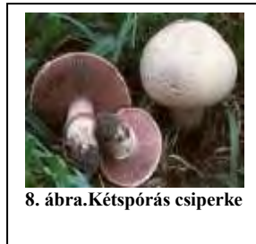
8. ábra.Kétspórás csiperke