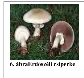
6. ábraErdőszéli csiperke