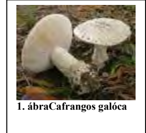
1. ábraCafrangos galóca