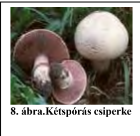
8. ábra.Kétspórás csiperke