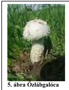
5. ábra Özlábgalóca