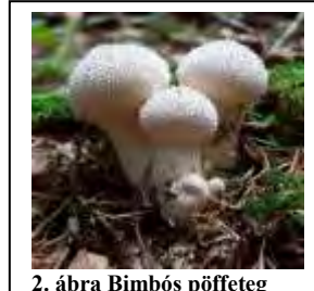
2. ábra Bimbós pöffeteg