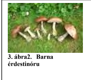
3. ábra2. Barna érdestinóru