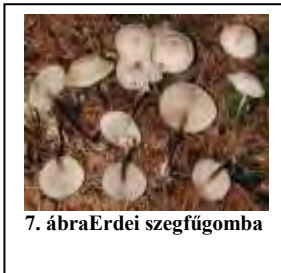
7. ábraErdei szegfűgomba