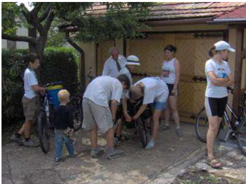
Júl. 10. vasárnap Tihany