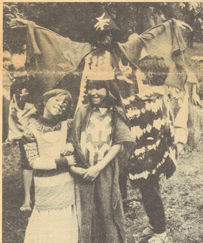
A játék egy pillanata