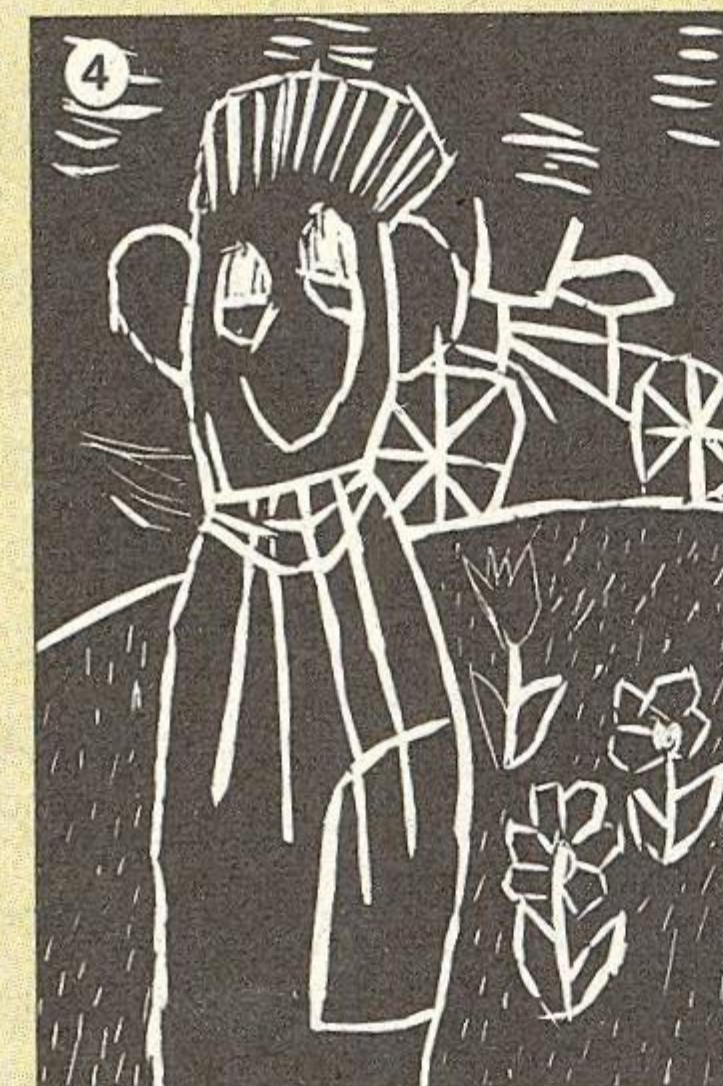
1 Petrik Éva, Mezőkövesd (14 éves) 2 Kíó Viktória, Mezőkövesd (14 éves) 3 Berceli Gergely, Szögliget címere (12 éves) 4 Burinda Bence, Az unokatestvérem emlékezetből (12 éves)