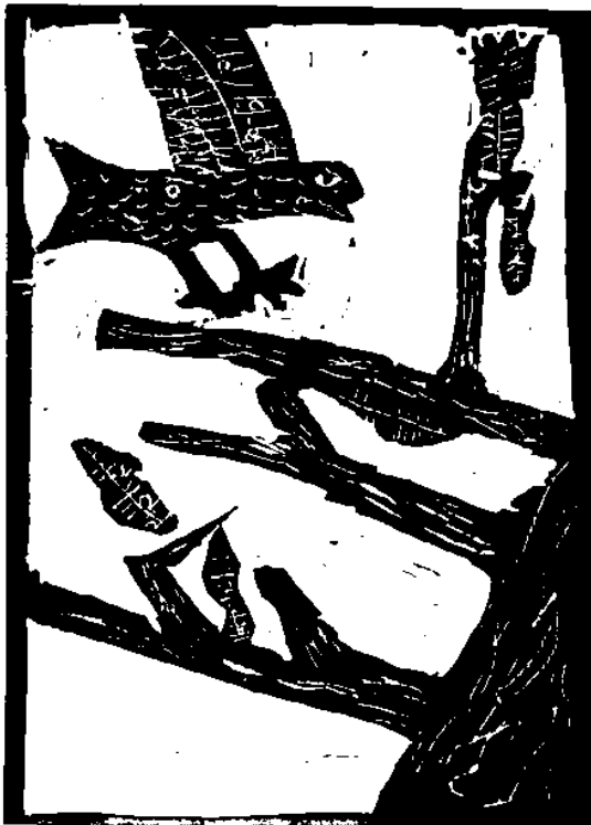
Képeslap méretű metszetek: