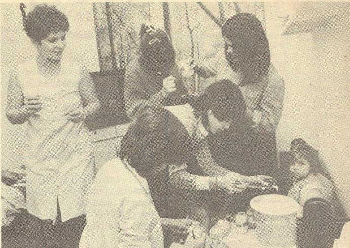
A játékszoba most festőműhellyé alakult